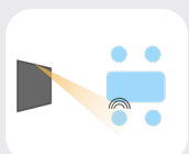
Suivi de la voix